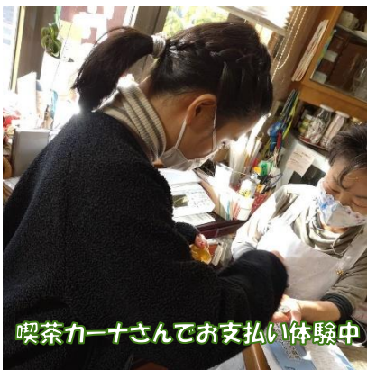
喫茶カーナさんでお支払い体験中