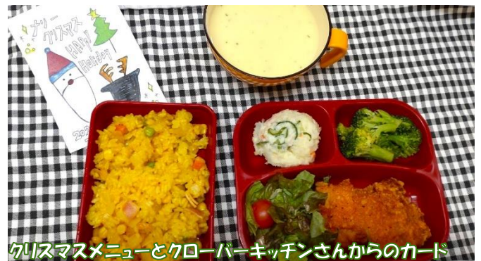
クリスマスメニューとクローバーキッチンさんからのカード