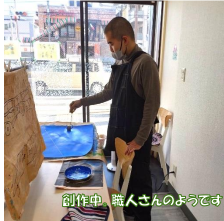
創作中。職人さんのようです