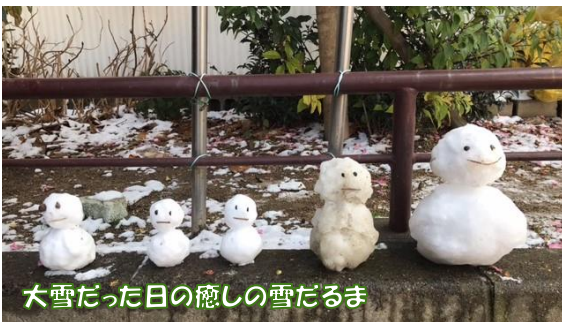
大雪だった日の癒しの雪だるま