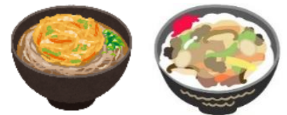
1月 かき揚げそば 12月 中華丼

毎月初めの土曜日に実施しているお楽しみ昼食は、皆さんに好評の丼物・麺類をご提供させていただいています。12月は「中華丼」、1月は「かき揚げそば」でした。特に麺類は皆さんあっという間に完食です♪